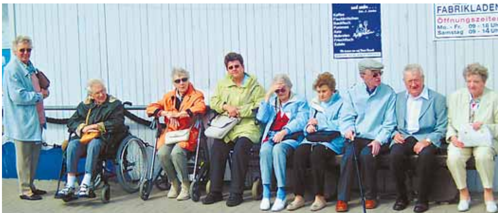
Bei den Bewohnern des Betreuten Wohnens in der Schinkelstraße kommt keine Langeweile auf.

*Macht bloß weiter so, das tut uns so gut!