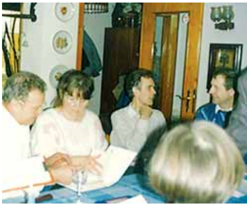
Die Gründung der AWO Kühlungsborn fand in einem privaten Wohnzimmer statt.

Weser-Ems/Kühlungsborn/Bad Doberan. „Gemeinsam mit den Partnern aus dem Weser-Ems-Gebiet kümmert sich die AWO in Kühlungsborn 1990 um Probleme der Seniorenheime und verteilte Hilfssendungen und Spenden. Die beiden Heime in Kühlungsborn bekamen Küchenmöbel, Hebevorrichtungen, einen Rollstuhl, einen Wärmeschrank, Bettwäsche, Handtücher und Vieles mehr“, so beschreibt 1990 ein Zeitungsartikel die Anfänge der Arbeit des AWO Ortsvereins Kühlungsborn und des Kreisverbandes Bad Doberan. Schon zwei Jahre schreibt dieselbe Zeitung: „Das Logo mit dem roten Herz ist aus der Sozialarbeit im Landkreis Bad Doberan nicht mehr wegzudenken“. Was war passiert? Wenige Monate nach Mauerfall führte es den damaligen Vorsitzenden der AWO Weser-Ems, Clemens Große Dartmann, privat nach Kühlungsborn. Bei seiner Suche nach einem Quartier kam er mit Menschen ins Gespräch, die Interesse daran hatten, Hilfebedürftigen zur Seite zu stehen und sich sozial zu engagieren. Schnell stand die AWO im Mittelpunkt und schon wenige Wochen später, am 11. März, erfolgte in einem privaten Wohnzimmer die Gründung des AWO Ortsvereins Kühlungsborn, der bis zu seiner Selbstständigkeit organisatorisch zur AWO Weser-Ems gehörte. Der erste LKW mit Hilfsmitteln für die Kühlungsborner Seniorenheime wurde begleitet von Uwe Röver, zu der Zeit Mitarbeiter der AWO Weser-Ems. „Uwe Röver war einfach da – als engagierter Freund - und half überall dort, wo wir Hilfe benötigten, sei es im Be-