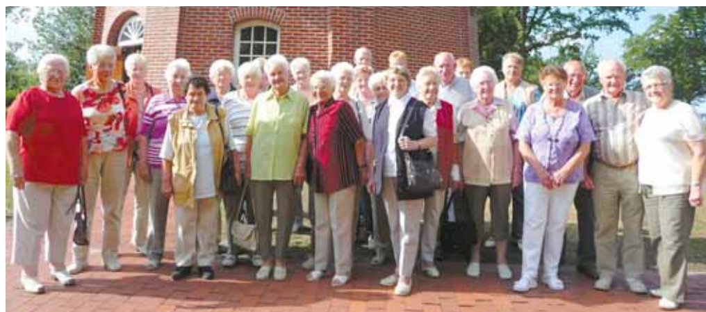
Die Brookmerländer vor der Zwischenahner Mühle.

Die Rücktour ins Brookmerland führte durch das landschaftlich schöne Ammerland. In Bad Zwischenahn machte die Reisegruppe zum Abschluss einen Zwischenstopp, um bei schönstem Wetter einen Spaziergang am Zwischenahner Meer zu machen.