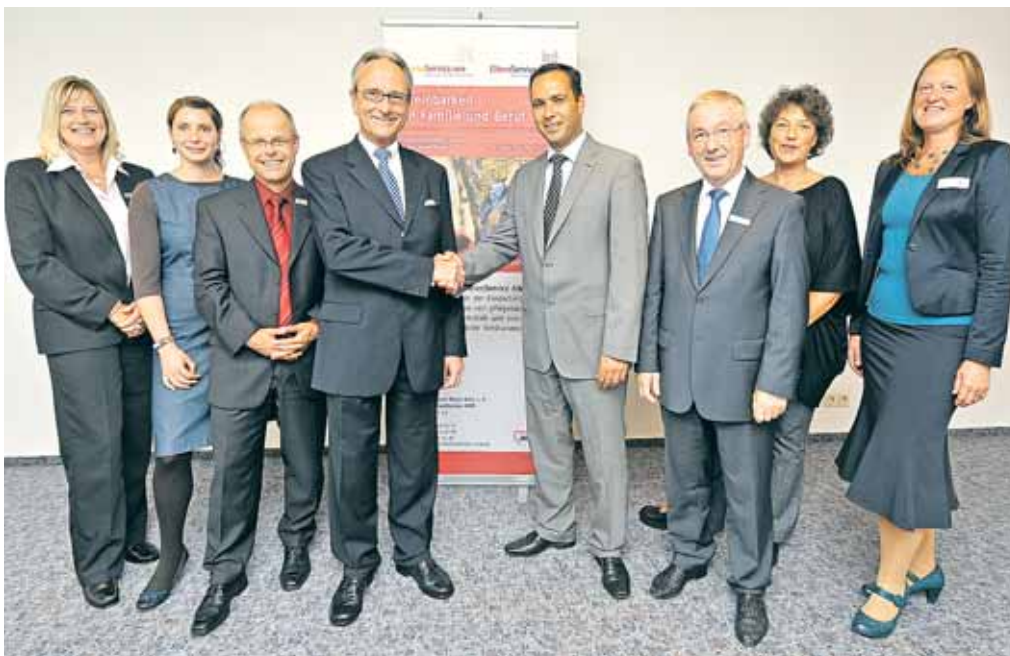
AWO und LzO: Ein gutes Team.