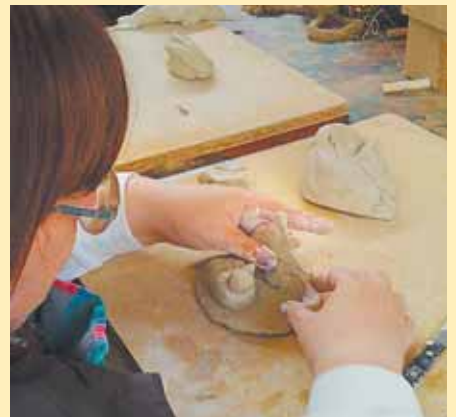
Eine Bewohnerin des Grünen Hauses visualisiert in Ton ihr schönstes Erlebnis.

Rastede/Wiefelstede. Mit dem Thema „Mein schönster Tag“ setzen sich in einem von der Landesparkasse zu Oldenburg (LzO) initiierten künstlerischen Projekt Bewohner des „Grünen Hauses“ auseinander. Sie hielten ihre Erlebnisse auf der Leinwand oder in kleinen Kunstwerken aus Ton fest, die anschließend in den LzO Filialen in Rastede und Wiefelstede ausgestellt und verkauft wurden. Der Erlös dient der Anschaffung eines Kräutergartens.