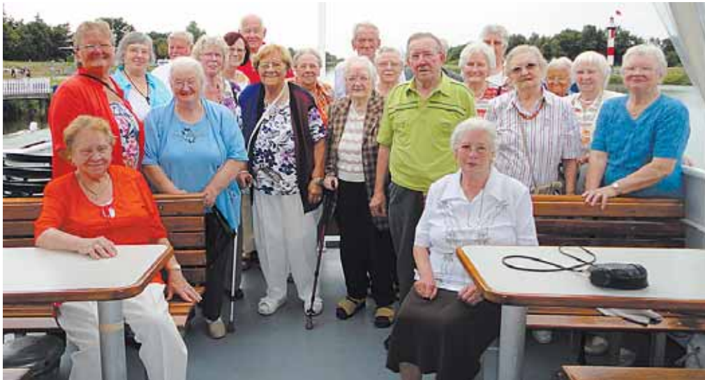
Ausflug per Schiff Kamperfehn. Ende Juli machten sich Mitglieder des Ortsvereins Kamperfehn auf zu einem Kurztrip mit der MS Spitzhörn. Während der zweistündigen Tour gab es Kaffee und Kuchen und es wurden viele Lieder gesungen. Alle Ausflügler freuten sich über das gute Wetter und genossen die Schifffahrt.